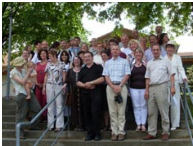
Gruppenfoto vom Absolvententreffen in Bautzen