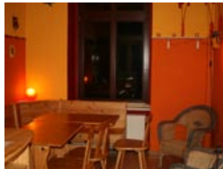
Die neue KSG-Bar