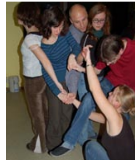
Der gordische Knoten stellte so manche Herausforderung an die Mitspieler

Für den Samstag war ein Ausflug nach Leipzig geplant. Das klingt wahrscheinlich ein wenig ungewöhnlich, wenn man zuvor aus Leipzig abgefahren war, doch selbst gebürtige Leipziger, die an dem Wochenende teilnahmen, konnten bestätigen, dass sie dadurch eine ganz neue Sicht auf ihre Heimatstadt gewonnen haben. Ziel des Ausflugs war das Stasi-Museum – für Viele ein spannender Einblick in die DDR-Geschichte. Mittag gab es dann in der KSG. Und bevor es wieder zurück nach Markkleeberg ging, stand der Besuch der Motette in der Thomaskirche auf dem Programm. Der Nachmittag verging wie im Flug mit