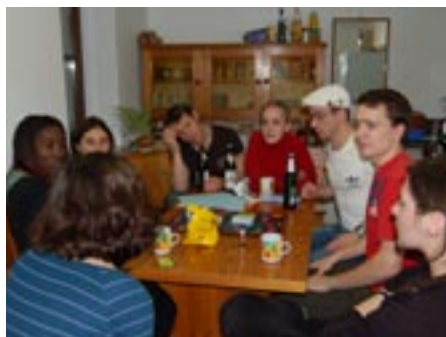
Beim Activity-Spiel wurde nicht nur nachgedacht, sondern auch viel gelacht

Aber wie ist eigentlich die Idee entstanden, ein Gemeinde-Wochenende zu veranstalten? Seit der Rom-Fahrt 2006 schien es Tradition zu werden, dass es in der KSG eine Art Gemeindefahrt gibt. Zu Pfingsten 2007 ging es dann auch gemeinsam mit einigen ESG-lern für acht Tage nach Taizé und um diesem Wunsch nach Gemeinschaft weiter nachzugehen, hatte Sabine die Idee, ein Gemeinde-Wochenende ins Leben zu rufen. Eine Kombination mit dem Neuenweekenende bot sich an, da damit vielleicht noch besser Kontakte zwischen Alt- und Neu-KSG-lern entstehen könnten. Und da kam eine der Absolventenspenden diesem Anliegen sehr entgegen: Ein Absolvent hatte eine größere Summe an die KSG gespendet mit der Bitte,